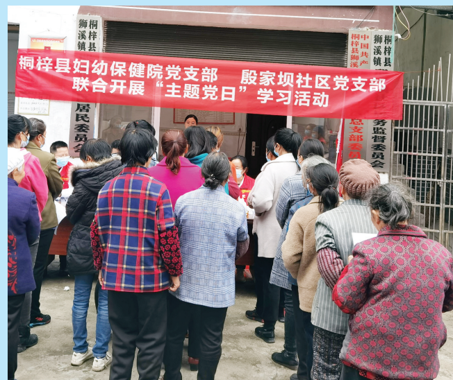
10月20日,桐梓县妇幼保健院党支部开展主题党日活动,组织党员前往桐梓县狮溪镇殷家坝村开展慰问老党员、免费“两癌”筛查等活动。