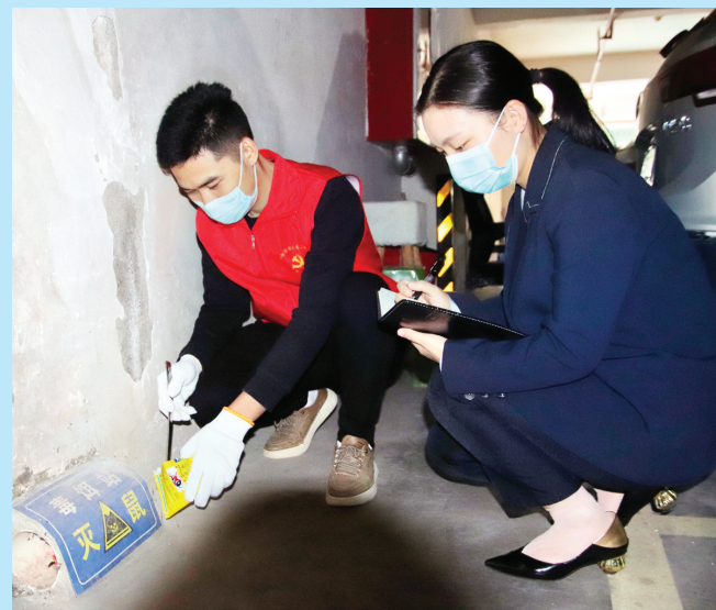
连日来,仁怀市市政公用公司党支部以“我为群众办实事”实践活动为抓手,组织党员志愿者深入城区部分农贸市场、地下停车场等地,开展防“四害”孳生专项治理行动。图为该支部党员志愿者向灭鼠毒饵站投药。