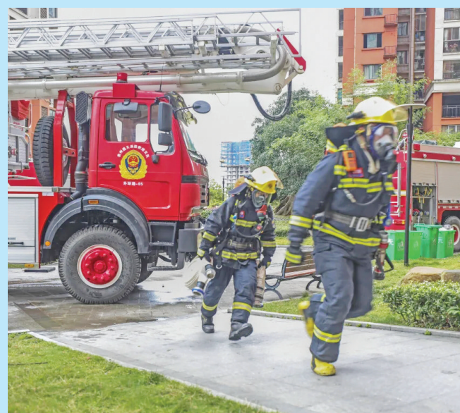
为提高消防救援队伍处置高层建筑火灾事故的能力,绥阳县消防、公安、供电、水务等部门日前联合开展高层建筑灭火救援应急演练。经过各部门通力合作,仅用20分钟,“大火”被扑灭,“被困者”被成功救出,实战演练圆满结束。