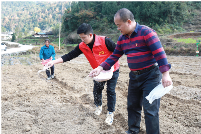
冬种时节,余庆县深入开展“我为群众办实事”实践活动,选派百名农技人才下基层,帮助解决农业小微企业、产业大户和群众在农业产业发展中的技术难题。 图为农技专家在余庆县白泥镇大龙村蔬菜基地指导农户科学播撒有机肥。