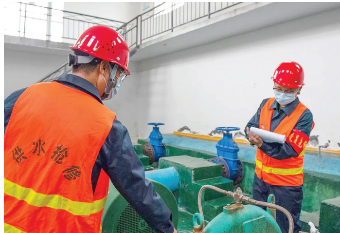
为确保冬季安全供水,播州区供水公司针对冬季生产特点,对供水管网和设备设施进行拉网式巡查巡检,制定完善供水设施防冻保温工作方案,提高突发事件应急处置能力,充分做好各项生产、服务准备,全力保障辖区居民冬季用水。图为播州区供水公司工作人员检查供水设施设备。