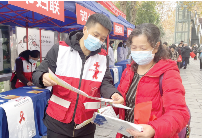
今年12月1日是第34个“世界艾滋病日”,当天,遵义市防治艾滋病工作委员会组织市、区两级相关成员单位及医疗卫生机构开展防艾知识宣传,向市民发放宣传资料并现场解答疑问,增强群众防艾意识。