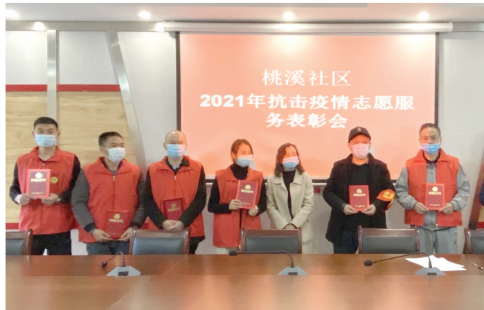
为树立榜样,弘扬志愿精神,日前,红花岗区忠庄街道桃溪社区对疫情防控志愿者进行了表彰,以激励更多人积极参与到社区服务中,推动社区形成共治、共建、共享的和谐局面。