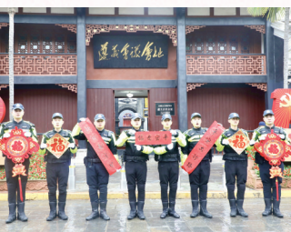
遵义交警支队机动巡逻大队为市民送上新春祝福。

“平安出行路,铁骑来守护”是我们的宣言。在新的一年里,我们将一如既往做好本职工作,加大城区巡逻管控制