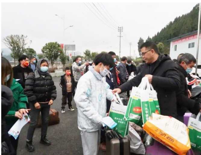
日前,习水县良村镇为50余名返岗外出的务工人员举行欢送仪式。活动中,该镇公共事务服务中心向外务工人员讲解了劳动合同签订、异地社保、医保政策等相关知识,并向外出务工人员发放了务工“爱心礼包”。