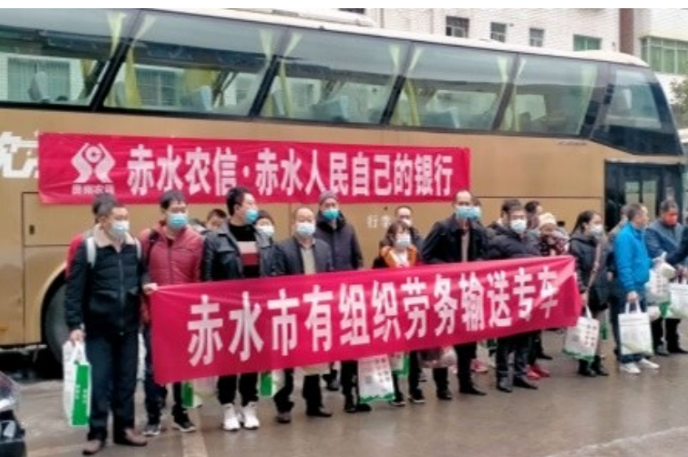
近日,赤水市举行外出务工人员返岗复工欢送仪式,欢送该市130余名外出务工人员赴厦门、东莞等地返岗复工。