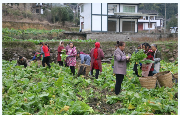
连日来,湄潭县抄乐镇羊角菜蔬菜基地里,村民们正忙着采收羊角菜。近年来,抄乐镇利用“烟菜轮作”模式发展冬季蔬菜产业,大力种植羊角菜。目前,该镇发展了羊角菜1100亩左右,亩产量达到4000斤以上。通过与重庆涪陵榨菜厂签订收购订单,解决了秋冬季土地闲置问题,也带动了群众务工增收。