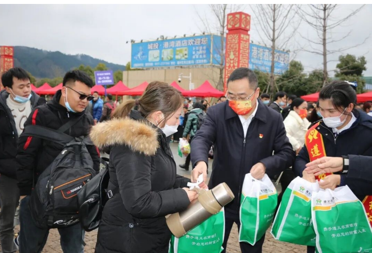
2月12日,遵义南站迎来播州区第二批“点对点”有组织的劳务输出2410名返岗务工人员,现场的每名务工人员领到一份来自遵义农商银行精心准备的“爱心礼包”。该批外出务工人员分别搭乘51辆返岗客车及高铁专列奔赴广东、浙江、福建、江苏等地返岗务工。