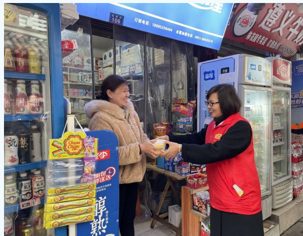
2月10日,红花岗区老城街道纪念馆社区开展了以“感党恩、颂祖国、庆元宵”为主题的元宵节活动,社区工作人员为辖区商户、独居老人等送上汤圆,让他们过一个开心、祥和的节日。