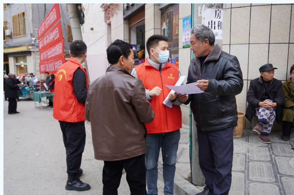
今年,桐梓县水坝塘镇紧紧筑牢就业民生底线,把农村劳动力外出务工就业作为重要民生工程来抓,在人流集中处开展创业就业宣传活动。图为党员志愿者向群众讲解就业相关政策。