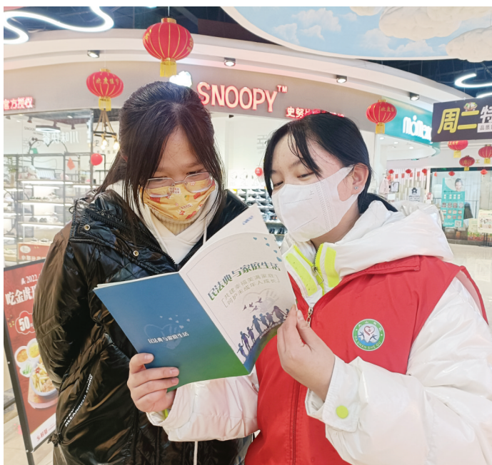
为增强全民法治观念、推进法治社会建设，近日，汇川区大连路街道大山社区党支部组织辖区党员干部、志愿者为居民讲解法律知识。图为普法宣传现场。