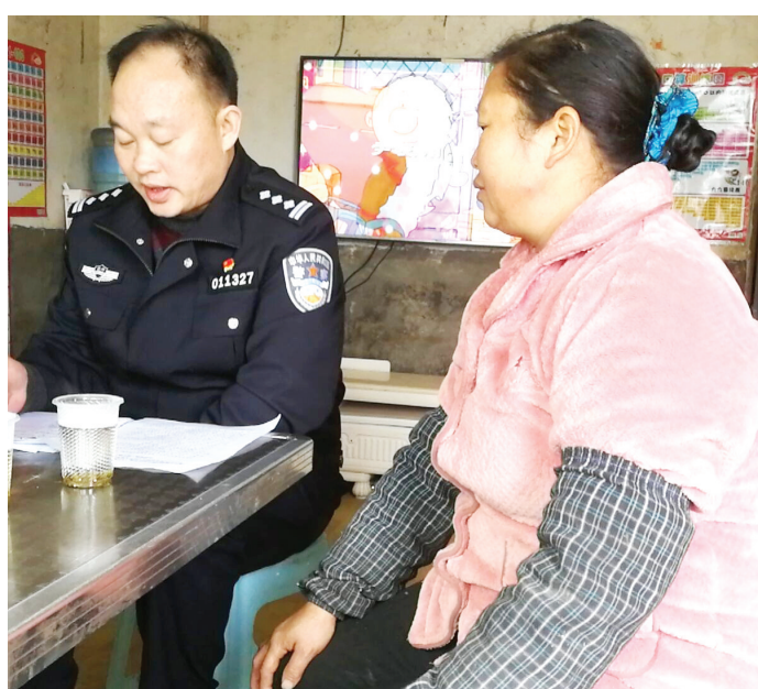
连日来，遵义市第三拘留所党支部组织全体党员民警深入播州区龙坑街道八里社区、金鼓社区，开展“入村寨进社区走企业访群众”大走访活动，向群众宣讲党的方针政策、法律法规，开展反诈防骗、扫黑除恶等知识宣传，并收集他们对政法信访工作的意见建议，进一步密切了警民关系。