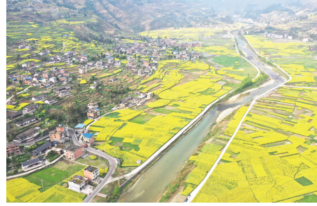
阳春三月,桐梓县狮溪镇万亩油菜花绚烂绽放,省内外游客闻香而来。

泡茶”、胜利社区日间照料中心,多渠道增加村级集体经济收入;加强关联配套企业招引和产业链延伸,抓好“官仓贡米”、柏林村“杯泡茶”、花椒农副产品加工,着力打造“官仓贡米”“逸麻腔”等特色产业地标品牌,增强产业发展后劲;依托土司古镇国家3A级景区和官仓村省级甲类旅游村寨名片,打造“剔骨鸭”“敖溪豆花”“敖溪羊肉粉”“敖溪砂锅饭”等非遗美食,实现一二三产高效融合发展。