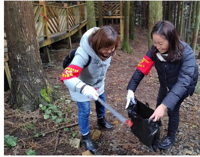
日前,道真自治县林业局组织开展“守护绿荫 绽放文明”志愿服务。图为该局干部在红关丫县级森林公园清理垃圾。

助完成了植树活动。生长在新时代的我们,要多学习雷锋精神,多参加社会实践活动。”仁和苑社区在职党员温泉表示:“此次活动不仅为红城遵义增添了绿色,还将党员同志凝聚起来,增进彼此感情。我一定会更加积极地参与到社区活动中,为社区治理工作添一份力。”