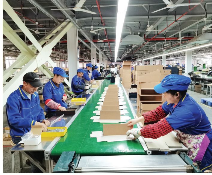
赤水市创亿佳包装制品有限公司生产车间一角。