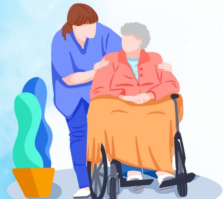
本版图片由市人力资源和社会保障局提供。