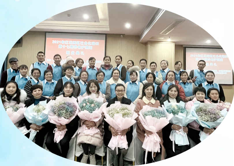
学员培训结业典礼现场。