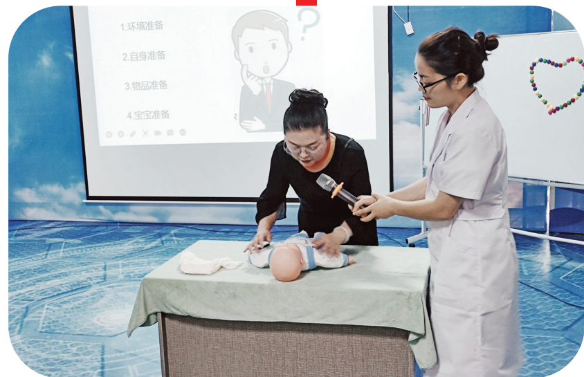
对保育员进行实操培训。