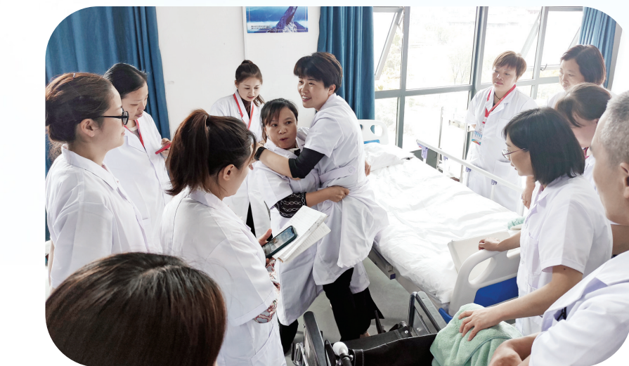
对护工进行实操培训。

近年来,我市已初步形成家政企业携手职业培训学校培育专业技能人才的模式,通过深度校企合作、定向对接,完成学员从学校学习到工作实习的无缝衔接,解决了家政从业人员培训结束后到工作岗位上的不适应问题,且收入比之前