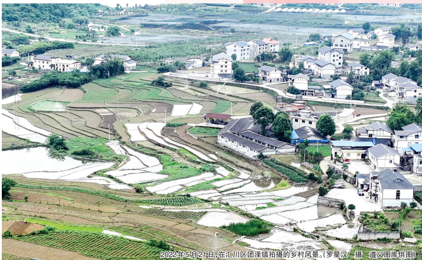
2022年5月21日,在汇川区团泽镇拍摄的乡村风景。