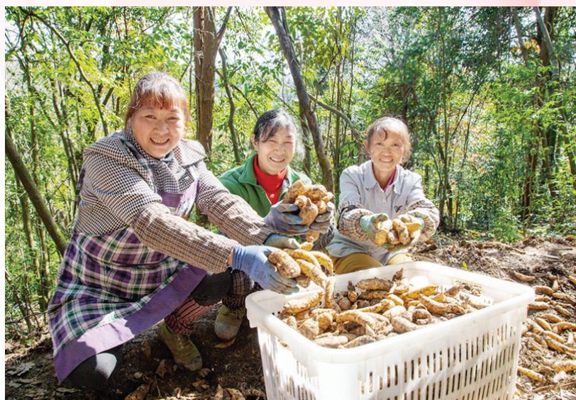
村民在汇川区板桥镇天麻基地采收天麻。