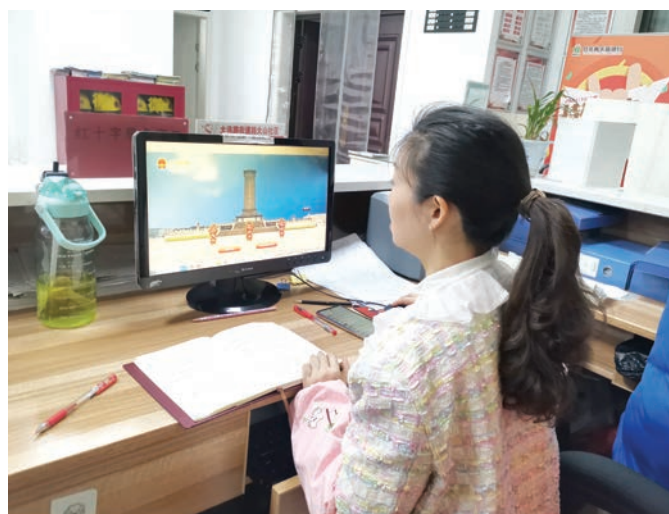
近日,汇川区大连路街道大山社区新时代文明实践站组织党员干部,积极参加以“清明祭英烈,文明慰忠魂”为主题的网上祭英烈文明祭扫活动。