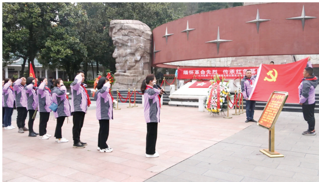
近日,汇川区第一小学明德校区组织党员教师代表、部分少先队员到红军烈士陵园,开展清明节祭扫活动。图为活动现场。

导、全民积极参与、社会热心支持的全民阅读良好工作格局,推动全民阅读深入基层、深入学校、深入文明实践站(所),不断推进文明实践工作向纵深发展。(仁怀市精神文明办)