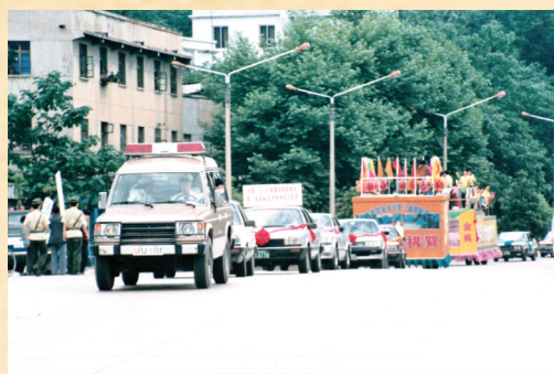
1991年,董酒获得日本东京第三届国际酒博会金奖称号。