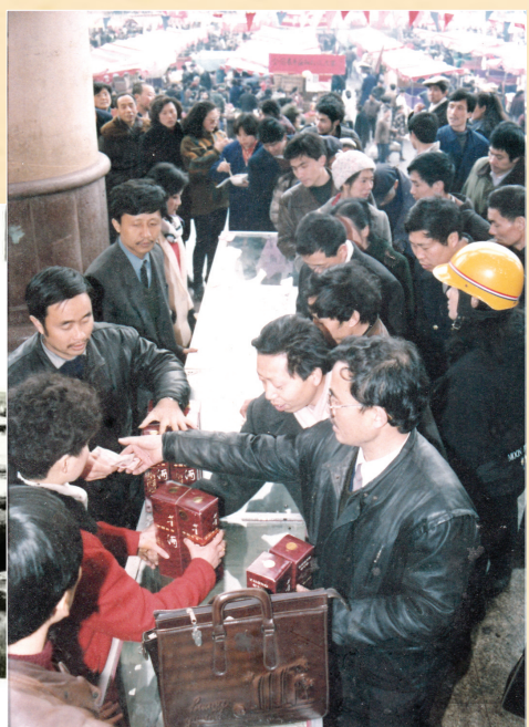
20世纪90年代,消费者购买董酒场景。