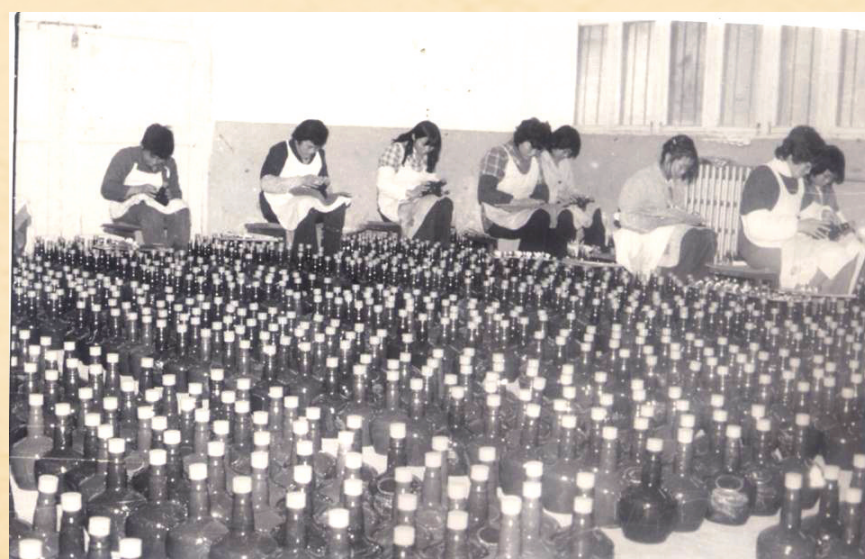
珍酒早期包装车间场景。