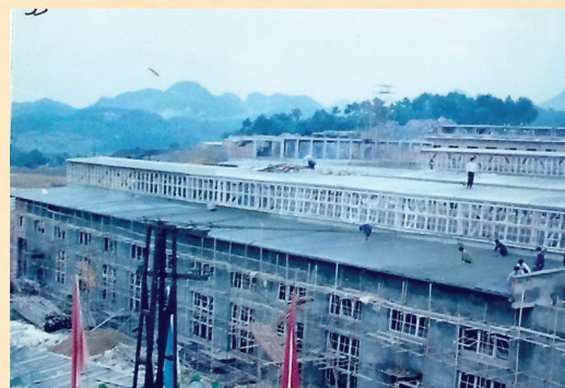
20世纪90年代珍酒厂扩建现场。