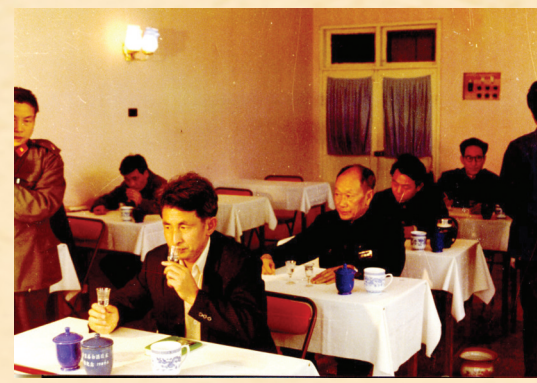
1985年,白酒业内高级别鉴定会在遵义召开。会上,珍酒得分93.2分。