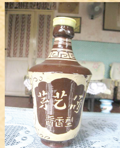
珍酒早期产品——1982年左右出品的茅艺酒。