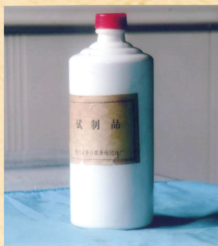
珍酒早期产品——1982年左右生产的试制酒。