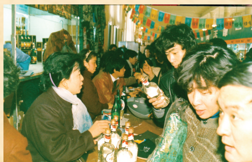
1990年,董酒荣获原轻工部“出口产品金奖”。

2007年4月,贵州董酒股份有限公司重组成立,提出“传承为根、酒质为魂、董道为本、汇利及仁”的16字企业运营理念,并按照“国密工艺”要求和质量管理体系标准,进行董基酒生产储藏,为董酒可持续发展奠定了坚实物质基础。2018年,董酒正式拉开了全国市场恢复性拓展的序幕。