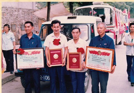
1984年,董酒在第四届全国评酒会上再次荣获国家名酒称号。