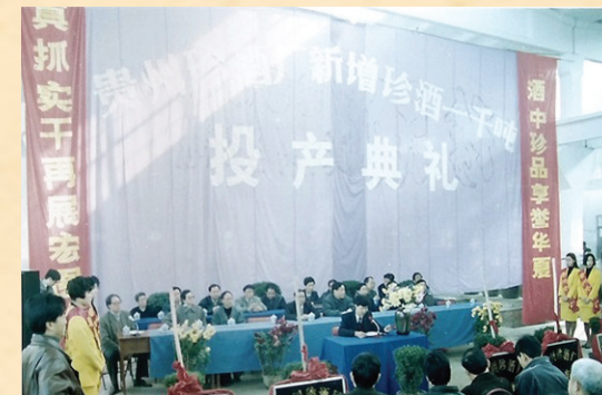
1993年,贵州珍酒厂新增珍酒一万吨产能投产典礼。