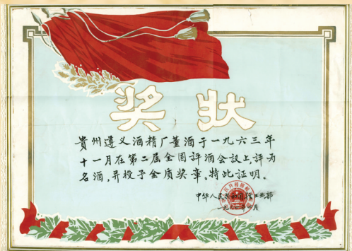
1963年,全国第二届评酒会,董酒首次被评为国家名酒。