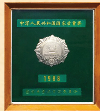
1988年,珍酒在第五届全国评酒会上荣获国家质量奖优质奖银奖,与茅台、习酒并称为“贵州三大酱香品牌”。