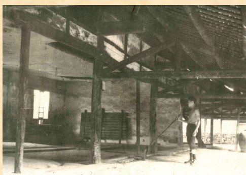
董酒厂建厂初期酿酒车间。