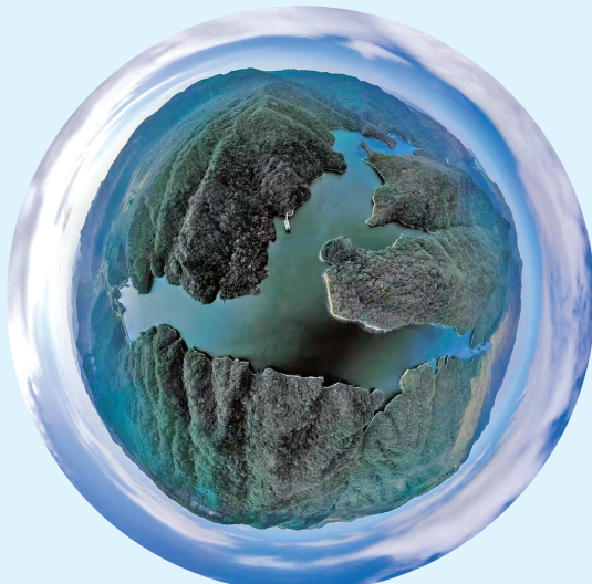
这是11月28日拍摄的贵州大沙河国家级自然保护区景色(无人机全景照片)。