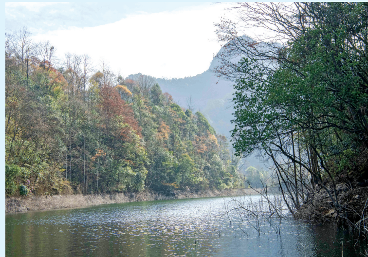
这是11月28日拍摄的贵州大沙河国家级自然保护区景色。