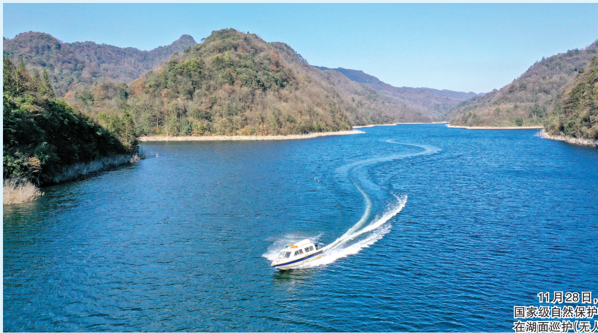
11月28日,贵州大沙河国家级自然保护区工作人员在湖面巡护(无人机照片)。