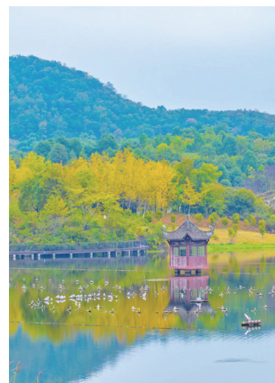
播州湿地公园的秋像是一幅辽阔的画卷，把秋天的美毫无保留地展现给人们。