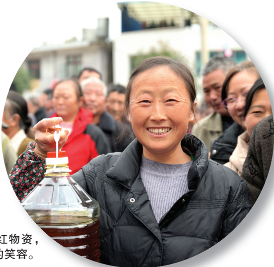
群众领到分红物资,脸上洋溢着幸福的笑容。

官田村的村合作社统一采购优质化肥,以每包低于市场价10元的价格卖给村民,实实在在降低了农户的生产成本。一桩桩民生实事,赢得了群众的口碑与信任。 “村级集体经济是乡村振兴的重要支撑。下一步,凤冈县将继续紧扣分红质量和覆盖面‘双提升’目标,进一步抓实党建引领发展,建强村干部队伍,持续壮大集体经济规模,完善利益联结机制,提升规范化管理水平,让村级集体经济成为推动乡村振兴、促进共同富裕、密切干群关系的坚实力量。”凤冈县委常委、县委组织部部长许峰说。