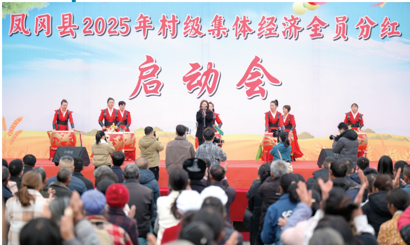
凤冈县2025年村级集体经济全员分红启动会。