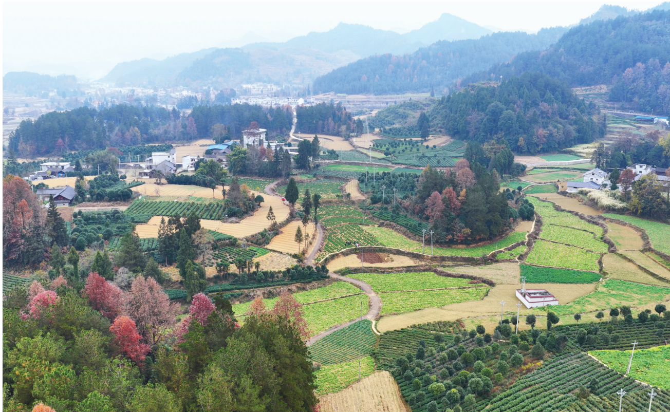
土溪镇石坝村股份经济合作社蔬菜基地。

12月9日,凤冈县2025年村级集体经济全员分红启动会在蜂岩镇朱场村举行。现场人头攒动,群众领到菜籽油分红物资,脸上都挂满喜悦和笑容。今年,凤冈县有47个村(社区)将陆续开展全员分红,占全县村(社区)数量的62%,分红资金达251万元,惠及群众23万人。 “全员分红是进一步检验村级集体经济真实情况的有效方式。抓和不抓,干和不干,完全是两个样。”凤冈县委书记马华说,从以点带面的试点示范到全县“一盘棋”的全面推行,从“扭负为正”“破零增值”到今天的全员分红,其实是凤冈县村级集体经济从以往单纯依靠循环“输血”,到当下渐渐能够内生“造血”,再到今后稳步蓬勃“活血”的探索实践。