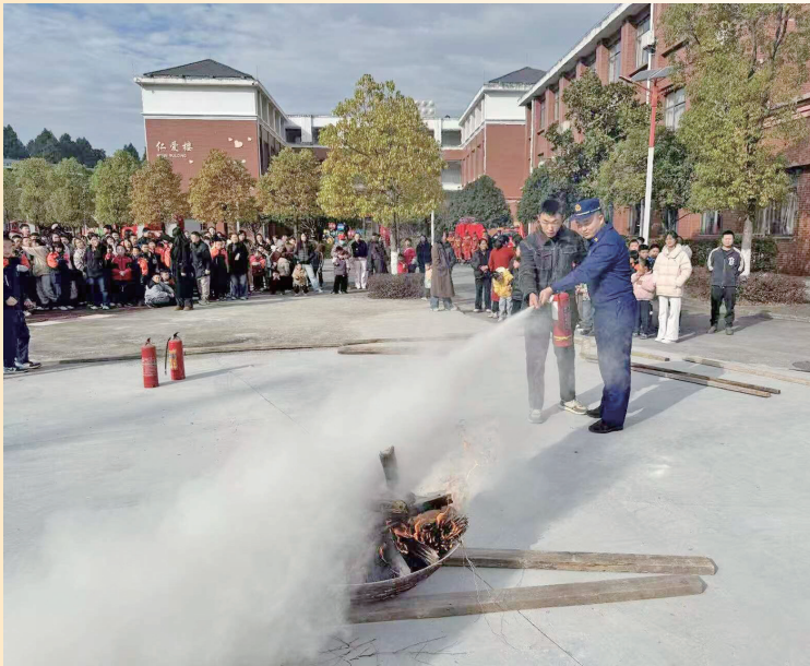
近日,习水县消防救援大队到该县特殊教育学校开展消防安全宣传培训活动。图为活动现场。

本报讯 (记者 雷宇)近日,道真自治县忠信派出所接到一村民紧急求助,称其在新民村麻鹰嘴半山采挖老虎姜时,因山势险峻被困,无法自行下山。接警后,民警立即携带绳索、急救包等救援装备,火速赶赴现场。 因麻鹰嘴山坡陡峭,崖壁崎岖,给救援带来不小挑战。警方当即制定方案:一人在崖顶固定绳索,建立安全支点,另一人沿绳索向下攀爬,逐步接近被困村民。 抵达被困村民所在位置后,民警一边检查其身体状况,确认未受伤,一边安抚其紧张情绪,为其穿戴好防护装备。在民警的护送下,该村民克服恐惧,沿着绳索向上撤离。 经过一个多小时的紧张救援,被困村民被成功转移至山下安全区域。