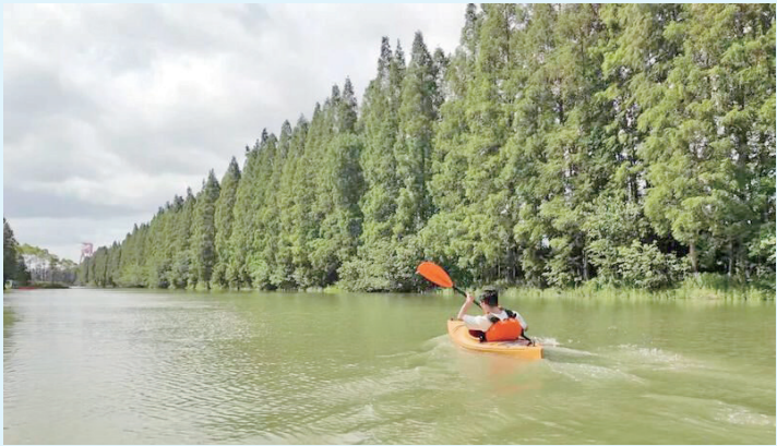
游客在长江林场体验皮划艇。