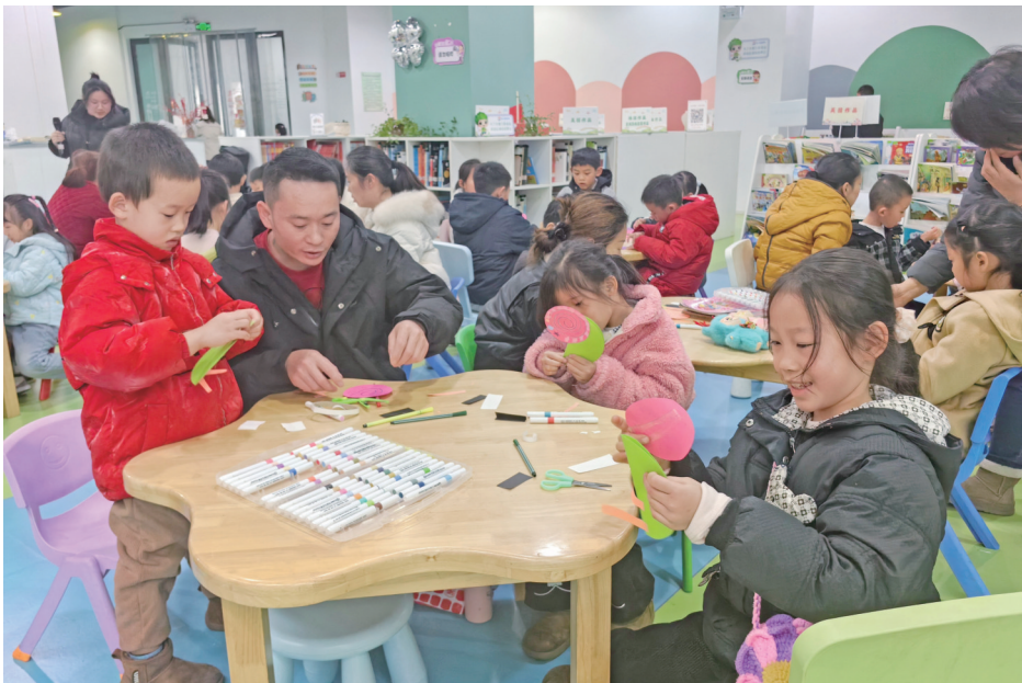
近日，遵义市图书馆2025年最后一期“红韵启智·亲子故事汇”阅读推广活动举行。在这一年里，该活动凭借独特的形式和丰富的内容，吸引了众多家长和孩子的积极参与，产生了良好的社会反响。 图为活动现场。

本报讯 近年来，赤水市元厚镇着力抓好生态环境保护工作，在污水治理、水域保护、农业面源污染防治等领域持续发力并取得明显成效，一幅水清、岸绿、景美的乡村生态画卷正徐徐展开。 针对生活污水治理，元厚镇将污水管网提效改造作为基础工程与“先手棋”来抓。今年以来，元厚镇累计投入资金234.1万元，新建及改造污水主干管网1500米，完成红军渡老街、桂圆林村沙沱等区域的支管网入户衔接，集镇生活污水集中处理率大幅提升，污水处理厂日均处理量220吨以上。他们通过系统推进污水“归家”、清水还河，从根本上削减了入河污染物负荷，镇域内主要河道水质得到明显改善。 为保护水域生态环境和渔业资源，元厚镇构建“人防+技防”的立体监管体系。镇里一方面组建巡查队伍，坚持每日重点巡查与不定期突击检查相结合，累计开展禁渔专项巡查340余次，对发现的问题及时处理；另一方面，采用无人机航拍强化禁渔巡查监管，实现全方位无死角智能巡查。如今，赤水河流域元厚段的非法捕捞现象得到有效遏制，水生生物多样性得到有效保护。 面对畜禽养殖粪污处理难题，元厚镇以“资源化、无害化”为导向，开展重点治理。据悉，元厚镇累计投入资金19.6万元，配套建设粪污储存罐23个、污水管700米、固态粪污发酵堆肥场4处。同时积极推广“种养结合”循环模式，引导群众消纳利用经处理的沼液和有机肥，不仅解决了粪污出路问题，还减少了化肥使用量，取得了环境保护与农业生产增效的双赢。 元厚镇副镇长李陈表示，下一步将继续坚持问题导向与效果导向，持续深化治理举措，补齐短板弱项，以更高标准、更实举措守护好绿水青山。 （帅继聪）