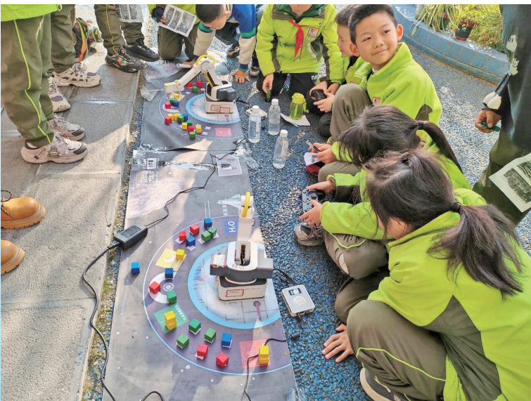
近日，播州区第一小学翰林校区以科创为媒、以趣味为引，举办了校园科技节活动，吸引了学校师生积极参加。 图为活动现场。

12月17日下午6时许，仁怀市国酒城，酒博汇里酱香氤氲，不少客商驻足品鉴；旁边的大都汇A区，网红餐厅也陆续忙碌起来；另一边的潮童汇内，孩子们欢声笑语不断。 国酒城商圈地处国酒南路黄金地段，涵盖4个各具特色的商业综合体，汇聚411家商业主体、12家线上